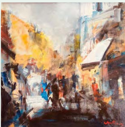
„Plac di Tertre - Paris“, ak. mal. Milan Martinec, olej na plátně, 50x 50, 24.000,-