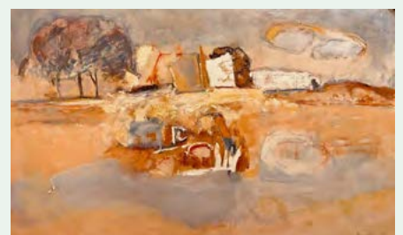
Václav Benedikt „Jemnosti okrové“, olej na plátně, 65x105, 59.600,-