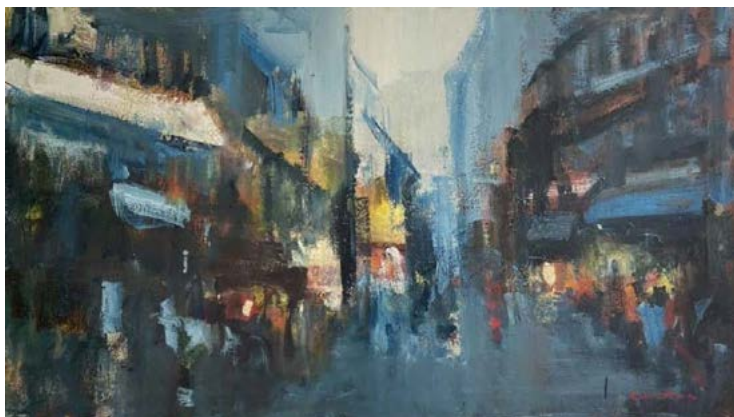
ak.mal. Milan Martinec , olej na plátně, 25.000,-