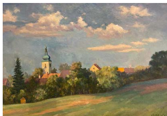
Vladimír Mencl, olej na desce, 34x45, 7.500,-