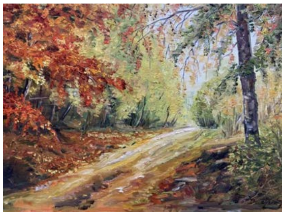
Květuše Burešová, olej na plátně, 50x40, 6.500,-