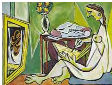
Picasso - „Muza“ - 1935