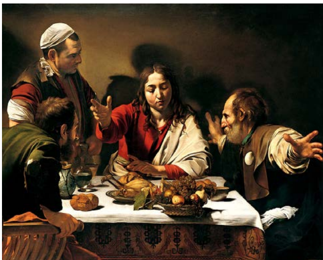
Večeře v Emauzích Michelangelo Merisi da Caravaggio